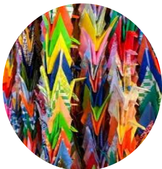
写真(しゃしん)はイメージ

京丹後市立大宮第一小学校が児童会を中心とした「笑顔の千羽鶴」活動として、新型コロナウイルスで学校が休校中に自分たちが今何ができることなのかを考えて、新聞で見た舞鶴市での「黄色いハンカチ」をヒントに「当たり前(あたりまえ)の日常(にちじよう)が戻る(もど)るように」と願(ねが)い、千羽鶴1300羽(わ)を作り、京丹後市役所大宮庁舎の職員の方に渡し、自分たちの願(ねが)いを託(たく)しました。そして、その千羽鶴は、大宮庁舎内に飾られ、来庁者にも折ってもらえるように、折り紙を置きました。